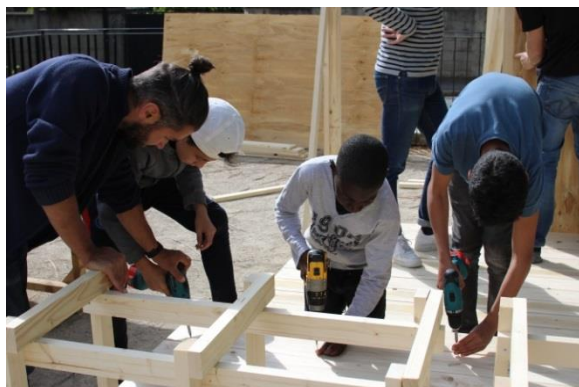
Ateliers de fabrication de mobiliers urbain – mai 2018

Lieu : Place du marché avenue Léon Eyrolles, Gare Cachan - RER A