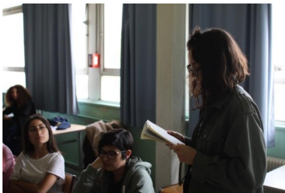
Ateliers d'écriture au Lycée Louise Michel - avril 2018