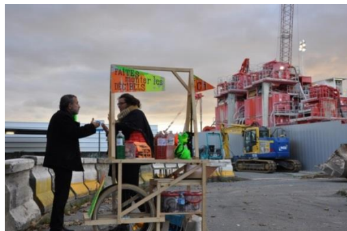
Bruits et Paroles – Gare des Ardoines - avril 2018 © Collectif Ne Rougissez Pas.