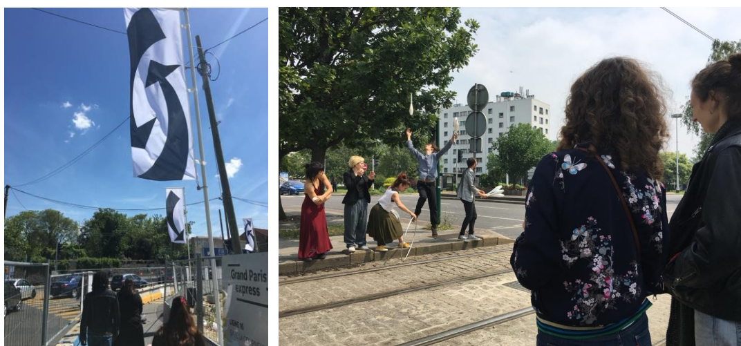
Totems des potentialités locales – 2018 ©Malte Martin / Agrafmobile.

Les collectifs et artistes des chantiers partagés et leurs partenaires locaux vous invitent à des moments de convivialité, de création et de découverte autour des travaux du nouveau métro. Au programme : ateliers, buvettes, repas, visites, performances, projections et lectures.