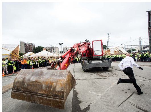
« KM1 », lancement le 4 juin 2016 du premier chantier du Grand Paris Express et de sa programmation artistique et culturelle sur le chantier de la future gare Fort d'Issy Vanves Clamart

Dès 2017 et jusqu'à l'ouverture des premières gares - formidable tremplin vers les Jeux Olympiques de 2024 et l'Exposition Universelle 2025 - le Fonds de dotation aura ainsi à cœur d'accompagner les projets de soutien à la jeune création, l'organisation d'événements fédérateurs sur les chantiers, ainsi que de nombreuses actions artistiques permettant de mobiliser la jeunesse des territoires. Grâce au Fonds de dotation, les entreprises pourront également soutenir la création des oeuvres originales dans les gares.