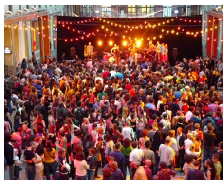
CENTQUATRE, Bal Pop